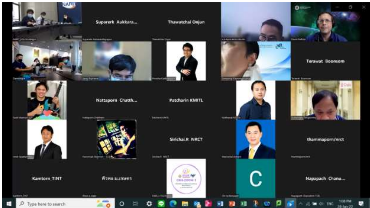
(ภาพการประชุมคณะกรรมการภาคีความร่วมมืออวกาศไทย ผ่าน zoom)